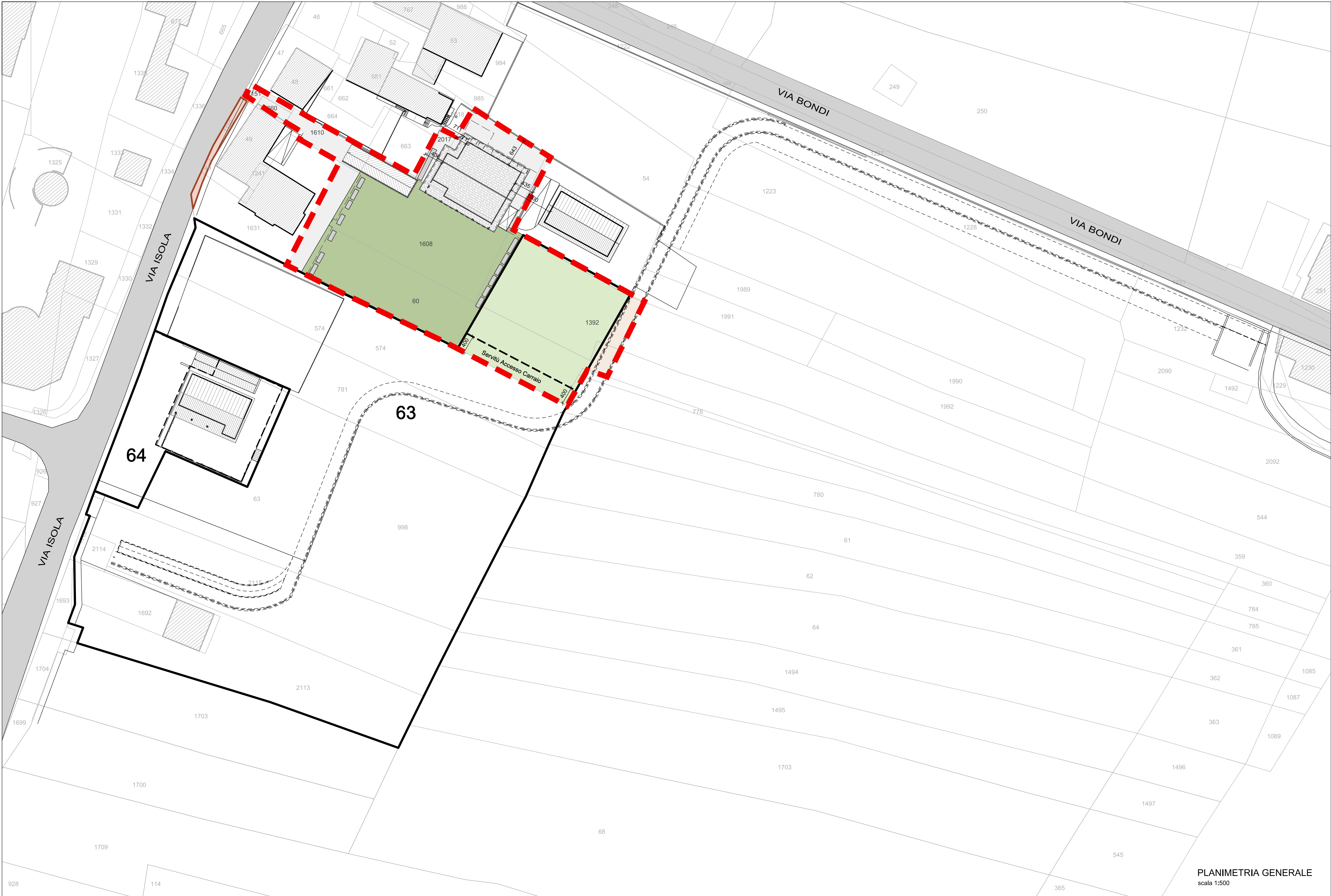
PLANIMETRIA GENERALE scala 1:500